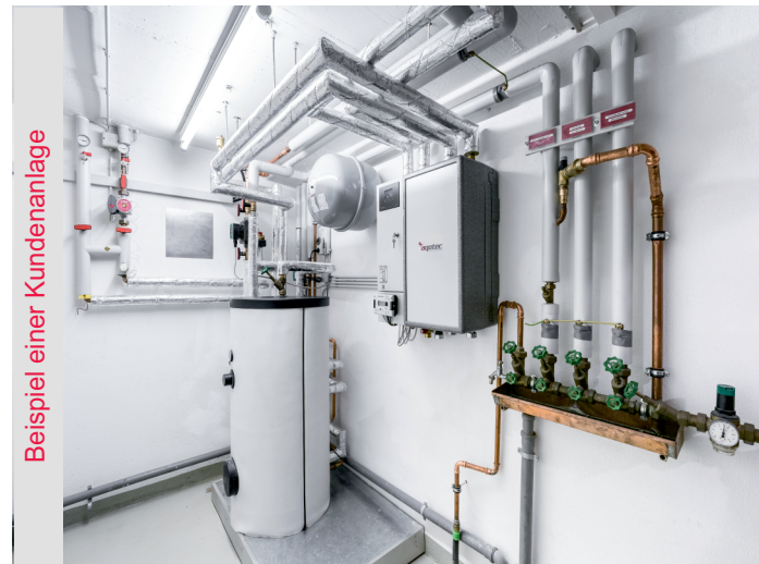
Beispiel einer Kundenanlage

Die Vertragslaufzeit beträgt 10 Jahre. Die Gestaltung der Wärmelieferverträge erfolgt strikt auf Basis der Verordnung über Allgemeine Bedingungen für die Versorgung mit Fernwärme (AVBFernwärmeV).